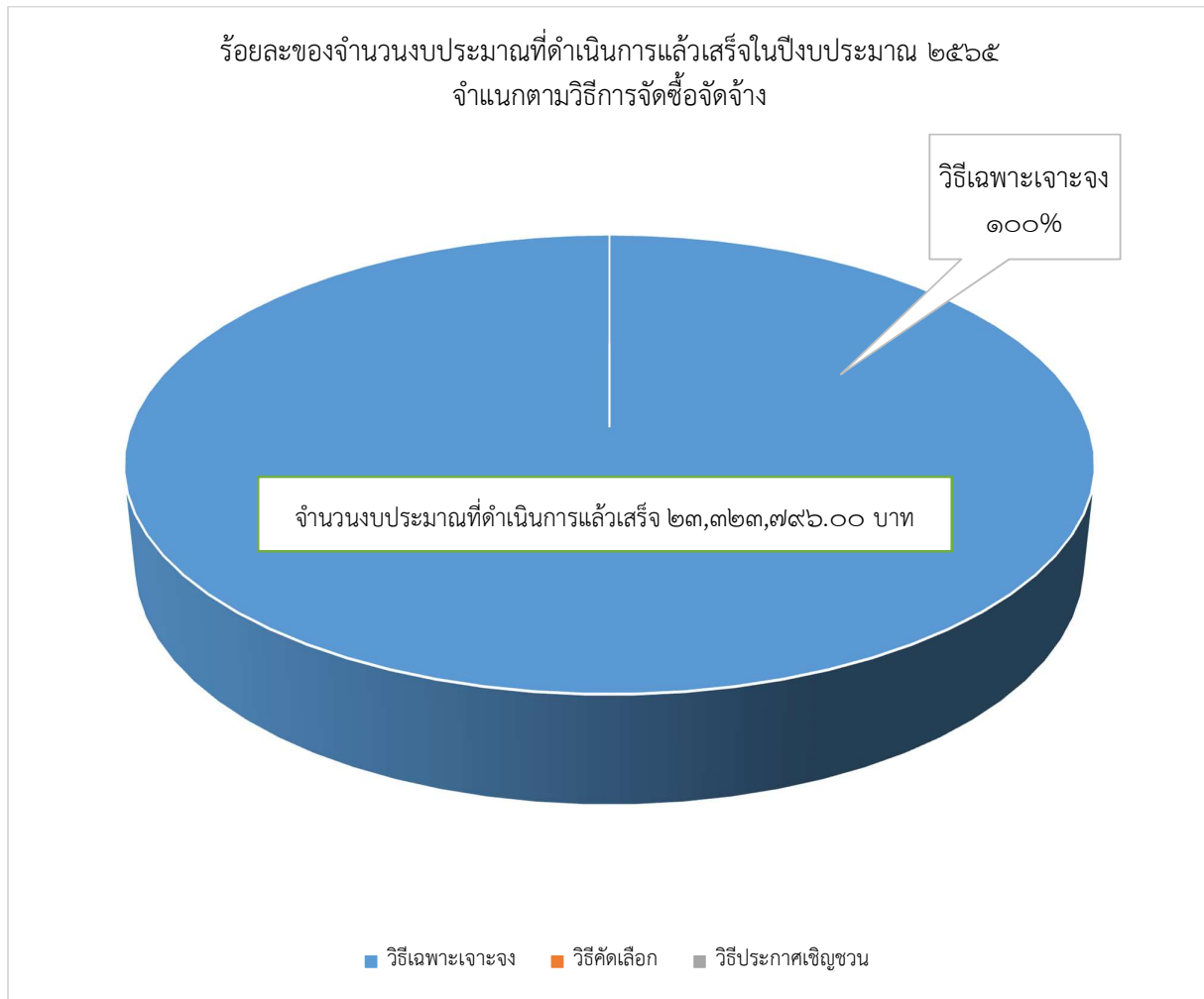
แผนภูมิที่ ๒ จำนวนงบประมาณที่ดำเนินการจัดซื้อจัดจ้างแล้วเสร็จจำแนกตามวิธีการจัดซื้อจัดจ้าง